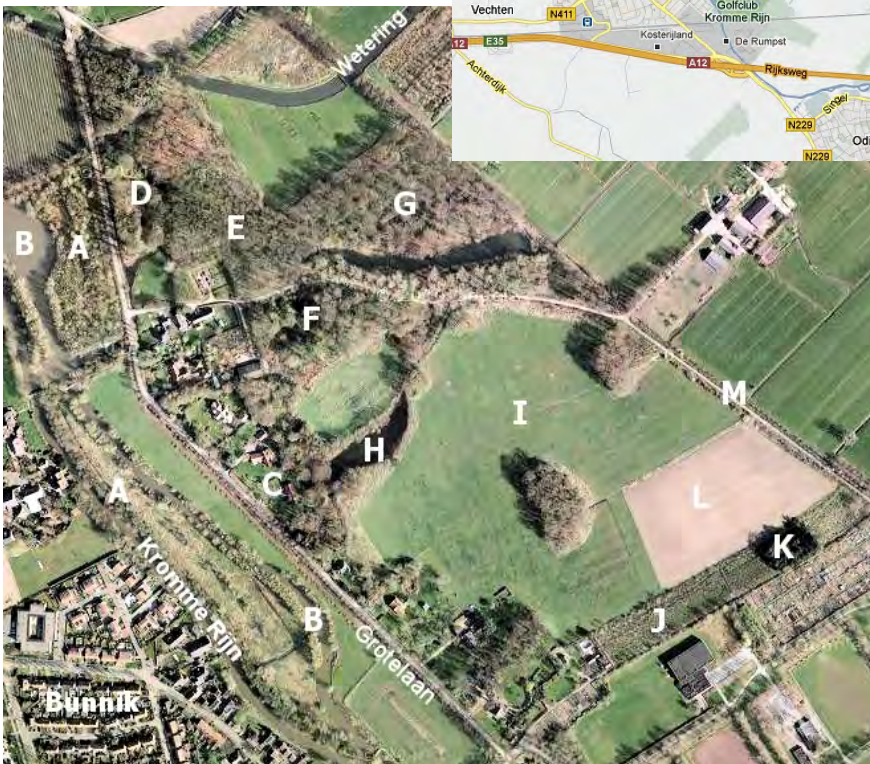
De Niënhof opgedeeld in biotopen.