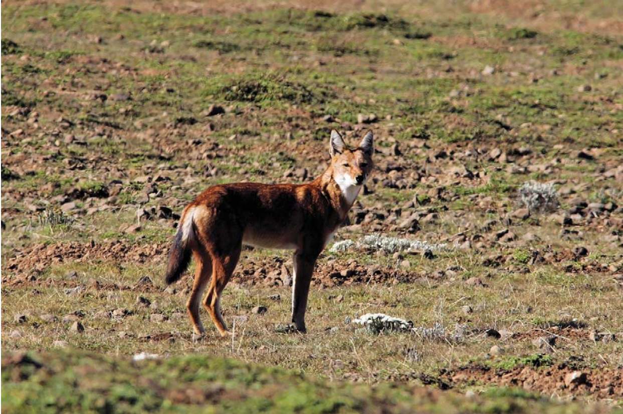
Ethiopische wolf - Jack Folkers

een na grootste kraanvogel is. Op de terugweg naar de auto zien we een wolf lopen die net een prooi heeft gevangen. Ik kan hem tot een meter of 40 benaderen. Dan begint hij naar me te blaffen en hou ik afstand want ik wil hem niet verblijven. Onderweg terug naar het hotel komen we ook nog spot-breasted lapwing's tegen (Ethiopische Kievit), weer een endem. Het kan niet op vandaag.