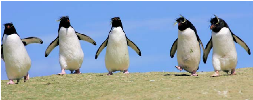
Rockhoppers op voedseltrek – Jack Folkers

jongen gekregen, dus kom niet te dicht bij. Niet dichterbij dan 5 meter. Meter!, 5 stappen! Mijn hemel, dat is superdichtbij. En al die pinguïns... niet te geloven. Hoe dichtbij mag je bij de pinguïns komen?, vroeg ik. "Als je gaat zitten, komen ze vanzelf naar je toe", was het antwoord. Ik was niet meer te houden! Even later zit ik aan de rand van de kolonie ezelspinguïns. En het klopt, ze komen dichterbij. Nieuwsgierig. Benieuwd wat voor rare vogel hun kolonie komt bezoeken. "Het is een vreemdeling zeker, die verdwaalt is zeker." Klopt ook! Een dwaalgast nog wel. Na een foto of 200 loopt de eerste pinguïn over mijn rugzak en niet veel later word ik in mijn schoenen gepikt. Wat als de zeeolifanten ook zo dichtbij komen, 4000 kg zwaar en 6 meter lang? De nabijgelegen kolonie van Magelhaenpinguïns is heel anders. In tegenstelling tot de ezelspinguïns maken deze hollen. Ze zijn schuwer. "Slechts" tot een meter of 3 à 4 te benaderen. Als je dichterbij komt, rennen ze hun hol in.