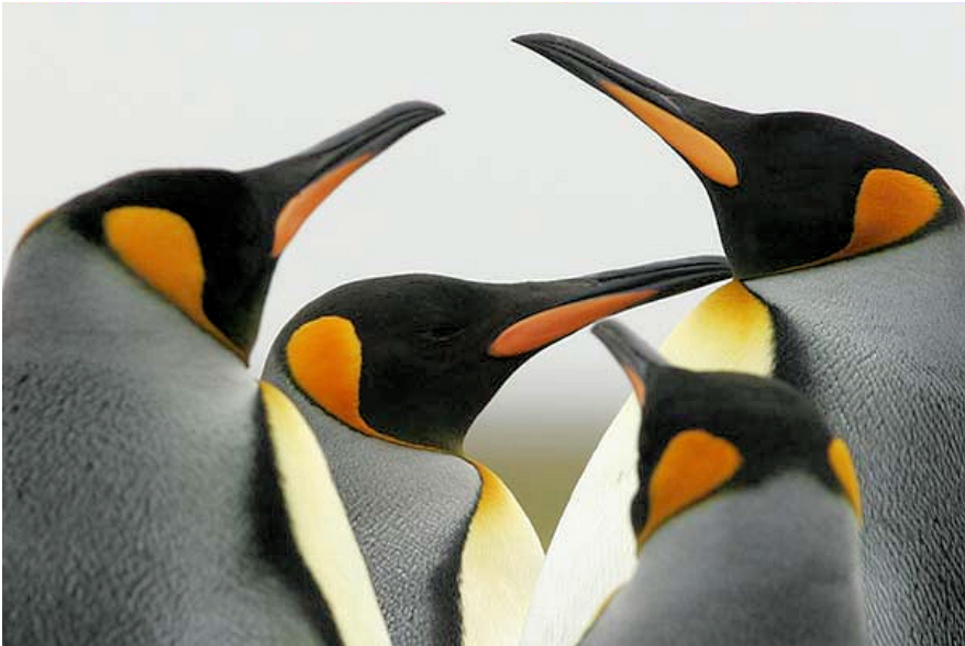
Koningspinguïns - Jack Folkers

Als ik terugkom, probeer ik vlak bij mijn nest te landen. Ik zie mijn echtgenote al zitten. Ze maakt opgewonden geluiden. Er is wat aan de hand! De eerste landing lukt niet... die rotwind! De tweede poging is wel beter al is het een buiklanding. Na het begroetingsritueel, snavelerijen en knuffels staat ze op en laat me vol trots in het nest kijken: een ei! Trots ga ik op het nest zitten en zwijmel over de toekomstige nieuweling.