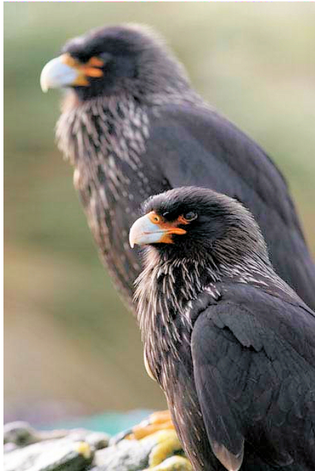
Crested caracara - Jack Folkers

In het nabijgelegen meer zouden zwartnekwzwanen moeten zitten en ik laat de albatrossen voor wat ze zijn en loop naar het meer. Het terrein is golvend, bedekt met lage heideachtige planten en "white-grass". Op sommige plekken moet je oppassen dat je je nek niet breekt want er zijn overal holen van pinguïns. In de verte verschijnt het meer en daarop 2 witte stippen. Jawel! Zwartnekwzwanen. Wat dichterbij gekomen zie ik ook de zwarte nekken en de knalrode snavels en nog dichterbij zie ik 2 grijze jongen. Op elke ouderrug een-tje. Het is hier lente en niet alleen de zwanen hebben jongen. Diverse eendensoorten zwemmen met pullen rond. Double-banded plovers (dubbelbandplevier) gedragen zich alsof ze zwaargewond zijn om me op die manier bij hun nest weg te lokken. Scholeksters zitten (hoe dom) opvallend op hun nesten en worden geplaagd door op eieren beluste Caracaras.