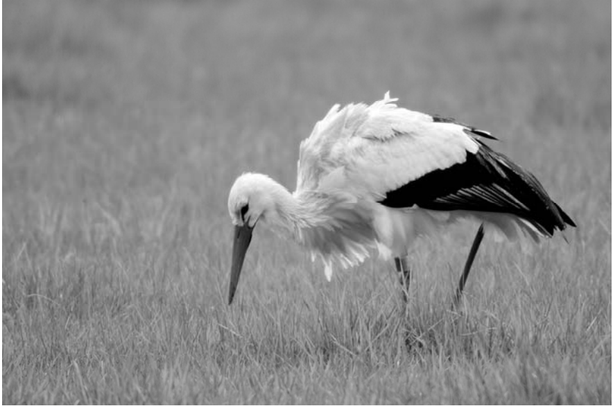
Ooievaar - Jan van der Greef

Tienhoven in de zomer (23 juni) vraagt om nader onderzoek. Wie weet wat? Er waren nieuwe vestigingen van ooievaars in Lopik, Blokland en Schalkwijk, waarbij opgemerkt kan worden dat dit laatste broedgeval waarschijnlijk een paar betreft uit Culemborg. In Westbroek waren dit jaar 5 nesten bezet. Ook bij de Schoolsteegbosjes in Leusden broedde 1 paar. Tegenwoordig is Vianen ook provincie Utrecht (SOVON-district 9). Hier broedde een paar net als in 2004 in het oude centrum. Uit Wijk bij Duurstede meldde men dat het broedsel mislukte.