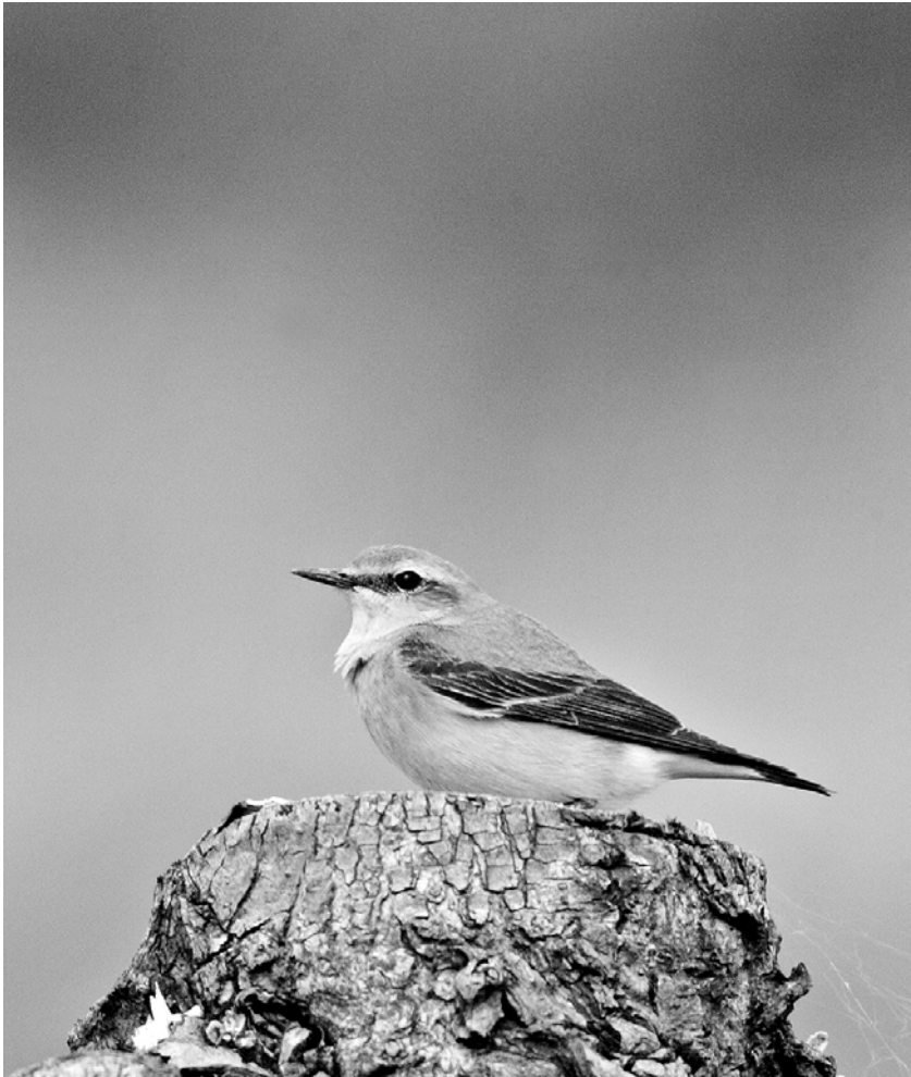
Tapuit - Jan van der Greef

2005 was het jaar van de tapuit . In Utrecht komen enkele gebieden in aanmerking als geschikt biotoop. Helaas is er tot nu toe geen territorium opgemerkt.