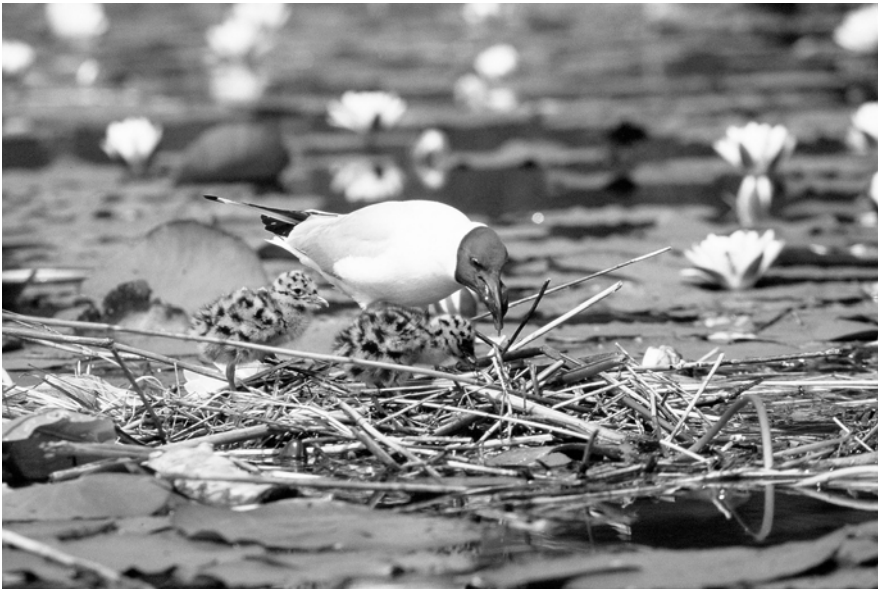
Kokmeeuw met pullen - Jan van der Greef

De kokmeeuwen broeden in Utrecht uitsluitend in het Vechtplassengebied en de randmeren. Elk jaar schommelen de kolonies qua aantal. Spectaculair is de aanwezigheid op een eiland bij de Stichtse Brug: 2200 paar. In de Vechtplassen gaat het om kolonies die nauwelijks boven de 100 uitkomen. Uitzondering is Botshol waar minimaal 380 paar hebben gebroed.