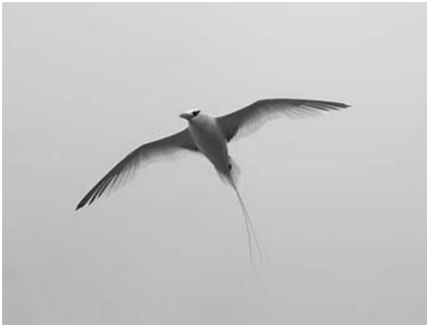
Roodsnavelkeerkringvogel - Jack Folkers

welke boot van hem was, een kleine polyester boot met een 40 pk motor. Maar hij moest eerst nog even naar huis om z'n zwembroek te halen. Ik stap vast in de boot en heb meteen een paar natte voeten want de boot staat halfvol water. Een angstige herinnering komt naar boven. In Belize ben ik een keer met een leuke roeiboot uitgevaren en dat was niet fijn. Het zou toch niet weer...? Ik begin maar een beetje te hozen. Na een kwartier komt Jose, de schipper, eraan. Hij heeft zijn 2 zoontjes meegenomen. De boot is inmiddels leeggehoosd en we kunnen vertrekken. Als we de Caraïbisch Zee opvaren worden de golven hoger en hoger en de ene harde klap na de andere krijgt de boot en vooral mijn rug, te verduren. Bovendien loopt de boot weer vol en doemen weer allerlei angstbeelden bij me op. Gelukkig komt Swans Caye in zicht.