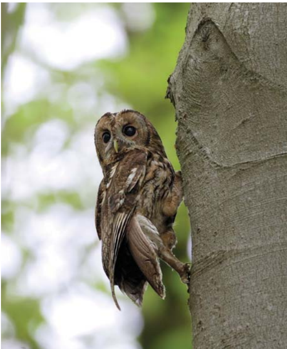
Bosuil - Jan van der Greef

En ja, daar was de uil dan; iedere dag. Hij vloog altijd weg als we de loods ingingen, maar erg schuw was hij niet. Een paar keer is hij bovenop de nestkast blijven zitten, zodat we hem goed konden bekijken. Het was een bosuil . Wat een mooie vogel, wij noemden hem Hibou (Frans voor uil).