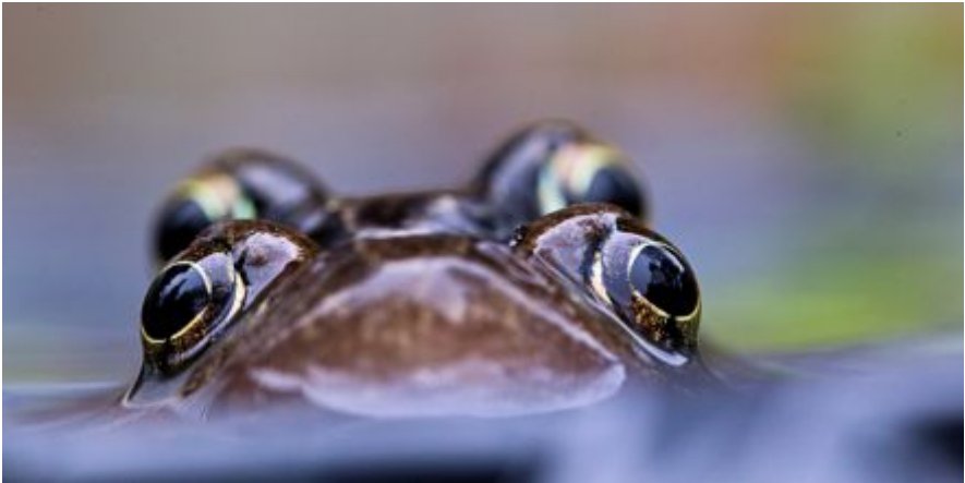
Bruine kikker - Jan van der Greef

Kennelijk zijn de moderne graslanden geschikt voor enkele andere soorten die in de afgelopen jaren in het graslandareaal zijn toegenomen. Grote zilverreiger en ooievaar vinden blijkbaar voldoende voedsel zoals kikkers en muizen, zwarte kraai (en kauw) voldoende kleiner gedierte.