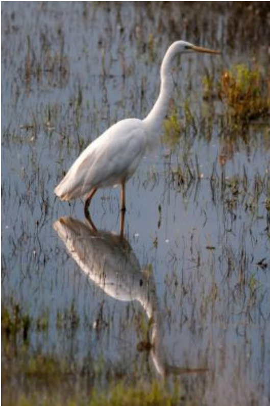
Grote zilverreiger - Jan van der Greef

Terwijl de in het weidegebied zo bekende blauwe reiger geleidelijk in onze omgeving in aantal afneemt, geeft de oorspronkelijk uit Oost- en Zuid-Europa afkomstige grote zilverreiger ("witte reiger") tegenwoordig in zomer en winter geregeld acte de présence. De soort broedt sinds 1978 in ons land, voornamelijk in de Oostvaardersplassen. Vogels die 's winters worden gezien, zijn deels uit buiten onze landsgrenzen gelegen broedgebieden afkomstig.