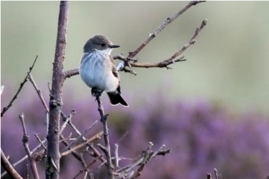
Grauwe vliegenvanger - Hans van Zummeren

verdwenen. Alleen in de trektijd wordt de afgelopen jaren soms een enkel exemplaar gezien. De grauwe vliegenvanger , voorheen een karakteristieke vogel van boomrijke boerenerven en landgoedtuinen, is sterk in aantal afgenomen, maar deze teruggang lijkt sinds kort tot staan te zijn gekomen.