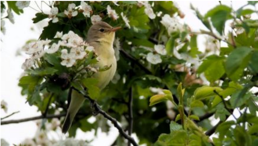
Spotvogel - Hans van Zummeren

Niet alleen ontwikkelingen in de eigen omgeving zijn van invloed op de veranderingen in de (avi)fauna. Ook ontwikkelingen in het buitenland kunnen gevolgen hebben. De situatie in Afrika, belangrijk overwinteringsgebied van veel van onze zomervogels, is van grote betekenis voor de overleving van bijvoorbeeld spotvogel, grauwe vliegenvanger en zomertortel. Vooral periodieke droogte en regenval in de Afrikaanse Sahelzone zijn bepalend voor de aantallen zomervogels die in het voorjaar naar onze omgeving terugkeren. Ook jacht op de trekweg van en naar Afrika kan van invloed zijn op de ontwikkeling van de populaties van vogels die in onze omgeving broeden.