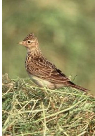
Veldleeuwerik - Jan van der Greef

Ook andere als weidevogel bekend staande soorten laten een gestage achteruitgang zien. Enkele soorten worden hier behandeld. De tureluur en patrijs zijn in de jaren zeventig en tachtig duidelijk in het Maartensdijkse weidegebied aanwezig. De tureluur houdt in het gebied ten zuiden van het dorp lang stand, zij het steeds in gering aantal (maximaal drie tot vijf paar), maar ruimt tenslotte in 2008 hier het veld. Worden in 1986 in de polders ten noorden van Westbroek door V/d B. en S. nog meer dan vijftig territoria vastgesteld, in 2010 kom ik in dat gebied niet verder dan hooguit vijf paren. De patrijs heeft waarschijnlijk in de loop van de studieperiode baat gehad bij het uitzetten voor de jacht. In het gemengde landbouwbedrijf van vóór de jaren zeventig was de soort een gewone verschijning (mededeling C.G. van Zijtveld e.a.).