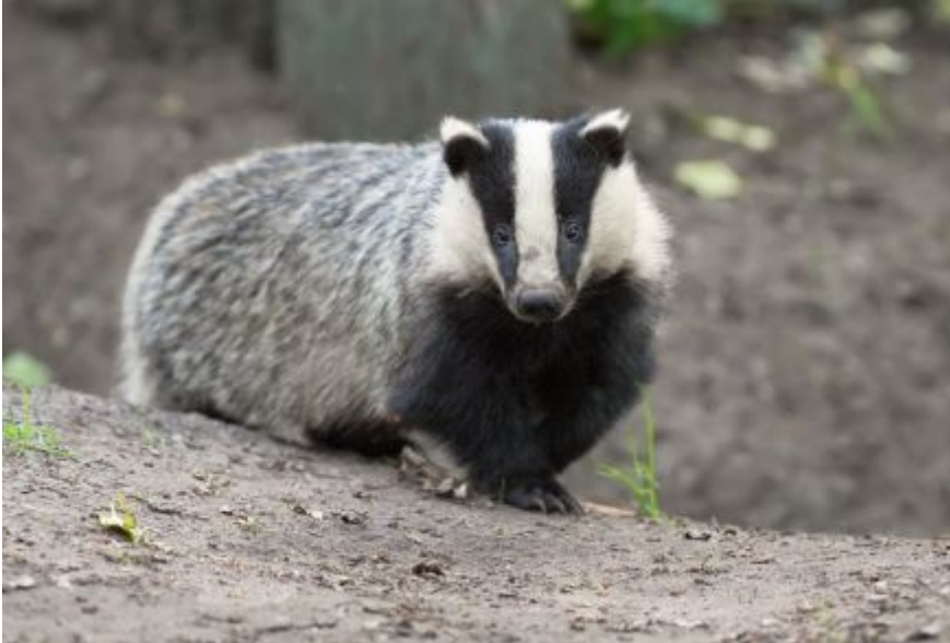
Das - Jan van der Greef

flora en fauna aan bod. De goede staat waarin het brede scala van dicht bij elkaar gelegen habitats verkeert, biedt een thuis aan vogels van zoet en brak water, kreupelhout, bossen, steile rotswanden en hellingen, steppe en weidegebieden met struikgewas. De variatie met kleinschalig cultuurlandschap versterkt dit nog eens. De flora wordt na een algemeen deel, in acht specifieke groepen onder de loep genomen. Bij de zoogdieren komen bruine beer, wolf, ree, das, hermelijn, wezel, boom- en steenmarter en vele anderen soorten aan bod. De grootste aantrekkingskracht gaat uit van de roofvogels. Er vliegen 22 van de 39 soorten die in Europa voorkomen. Het hoofdstuk wordt afgesloten met reptielen, amfibieën, vlinders en overige ongewervelde dieren.