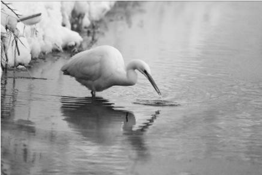
Grote zilverreiger - Jan van der Greef

Een boek met heel veel informatie voor iedereen die meer wil dan een kiekje of een bewijsplaatje schieten en zichzelf gewapend weet tegen overtreding van het bovenvermelde gebod.