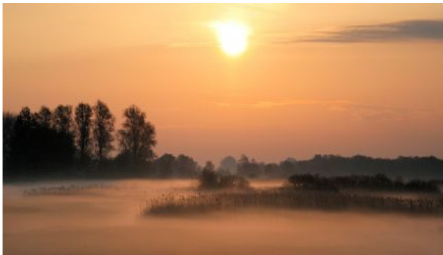
Bethunepolder in de ochtendmist - Jack Folkers

Hier doe je het voor! Niet alleen voor de vogels, niet alleen voor de telling en de lijstjes, maar voor het geweldige genieten!