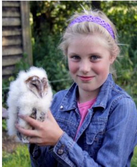
Julia met jonge kerkuil - Richard Pierson

Op 3 juli werd de laatste roepende vogel gehoord. Kwartelkoningmannen stoppen