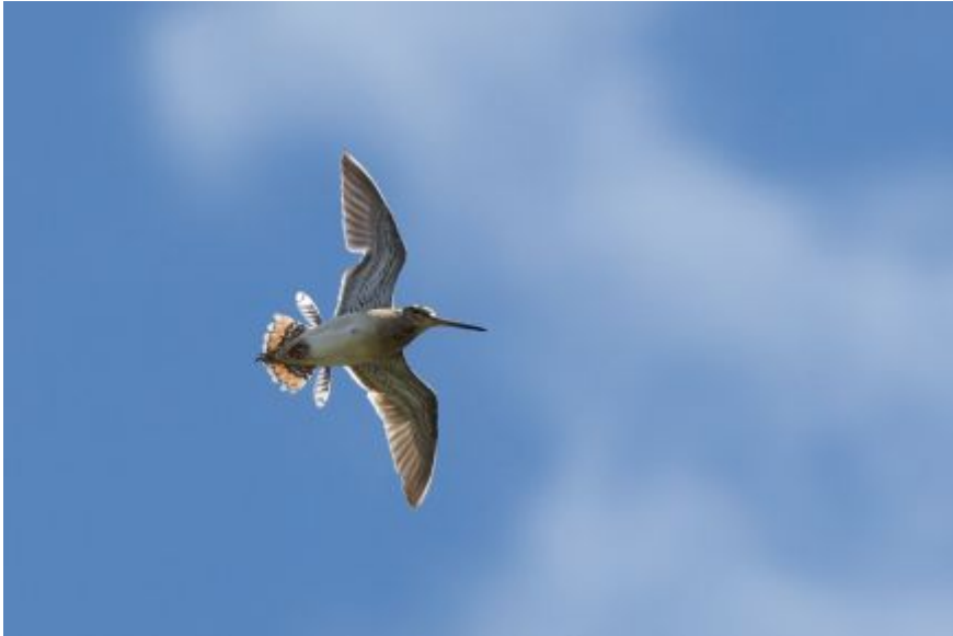
Watersnip baltsend - Jack Folkers

antwoord: vanuit het midden van het land. Hij heeft zelfs gewacht met het maaien van het "kwartelkoningendeel" om de mogelijk broedende kwartelkoningen te ontzien. Daarover verderop in dit artikel meer.