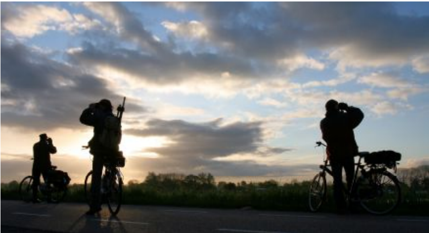
Team 2 tijdens Big Day Utrecht - Gerrie Abel

Op 12 mei 2012 werd voor het eerst een Groene Big Day in Utrecht georganiseerd. Twee teams streden tegen elkaar om binnen de grenzen van de provincie Utrecht in 24 uur zoveel mogelijk vogelsoorten te zien. Alleen "groene" vervoermiddelen waren toegestaan (dus niet met de auto). De eerste helft van mei is de beste tijd om een Big Day te houden. Dat komt omdat dit de periode is dat de meeste vogelsoorten kunnen worden aangetroffen; veel zomervogels zijn al terug, nog niet alle wintergasten zijn vertrokken en de vogeltrek is nog in volle gang. Het eerste team bestond uit Marian Peterse, Anton Schortinghuis en Bart de Knecht. Het tweede team bestond uit Kees de Leeuw, Leo Kramer en Gerrie Abel. Hier volgt het relaas van het tweede team.