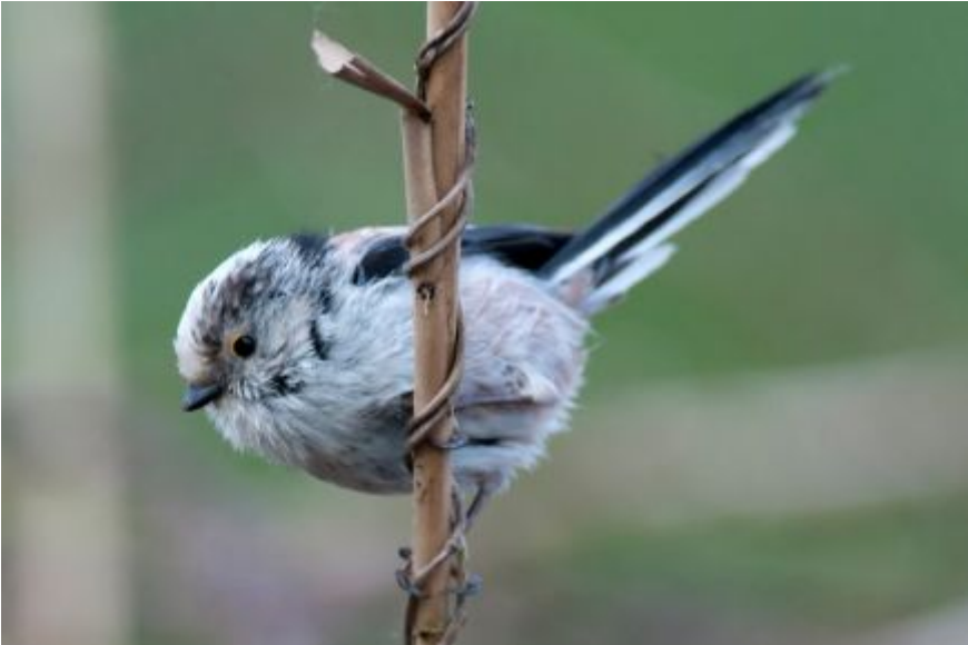
Staatmees - Hans van Zummeren

Onze teller stond op 90 en ons doel, 100 soorten, kwam al in zicht. We besloten er nog een schepje bovenop te doen en de lat hoger te leggen. Daarvoor staken we de rivier de Lek over bij Vianen en gingen richting Everdingerwaard. Een mooi stukje natuurontwikkeling van het Utrechts Landschap in de uiterwaarden van de Lek. Omdat we de wind aardig zat waren, gingen we onderaan een dijkje vogels kijken. We kregen het gevoel bij een voorstelling in een openluchttheater te zijn. Er waren optredens van broedende kluten, foeragerende bontbekplevieren, baltende kleine plevieren en invallende gele kwikstaarten. Het was lastig hier afscheid van te moeten nemen.