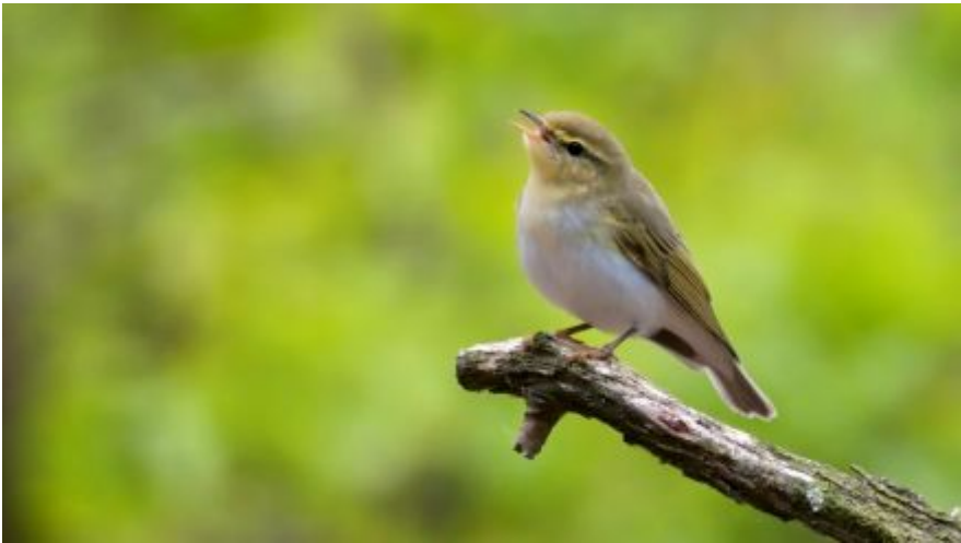
Fluiter - Hans van Zummeren

Als om 6.15 uur de krantenjongen in zijn bestelauto passeert, heeft de zon zich inmiddels laten zien en is het vroege zangkoor in volle gang met onder andere merel, zanglijster, winterkoning, houtduif, fitis en rietgors. Al snel loopt het aantal soorten op tot boven de 50 en bij iedere soort kwam de mededeling: "Je kunt hem alvast maar hebben". Het werd de lijfspreuk van deze dag.