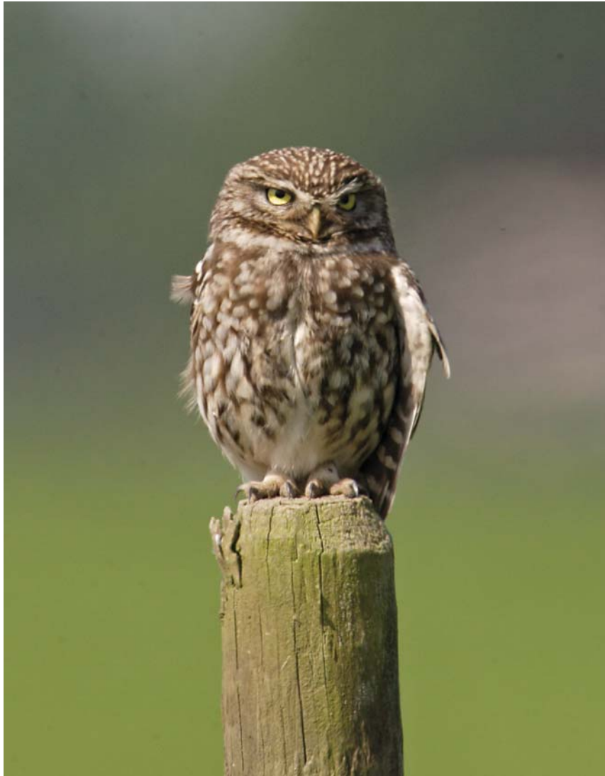
Steenuil - Jan van der Greef

de en kwalitatief geschikt biotoop. Misschien kan aanvulling plaatsvinden vanuit buurgebieden met een goede steenuilenstand, bijvoorbeeld vanuit de oostkant (Oostelijke Eemvallei, Bunschoten, Hoogland, Nijkerk).