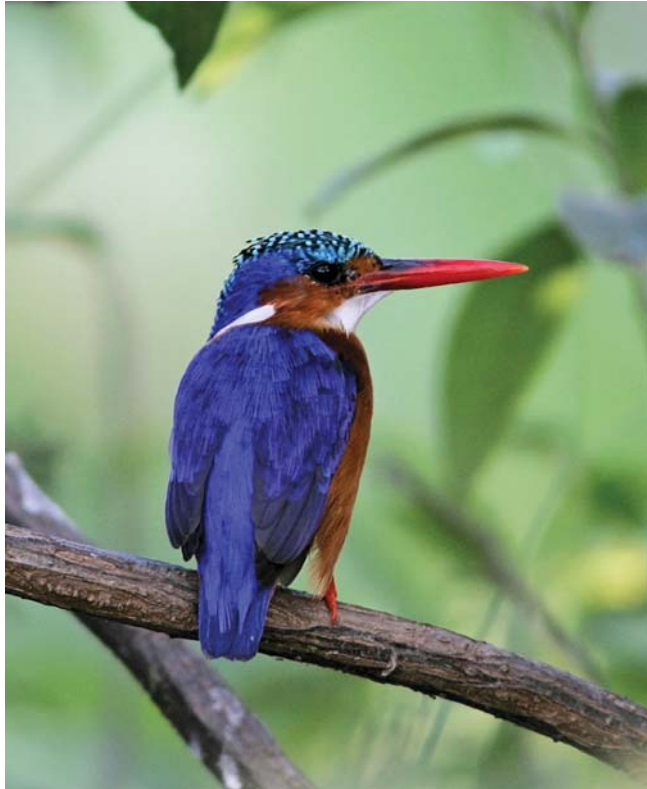
Kleine gekuifde ijsvogel

Ik ga nog een stuk verder om de vogel beter te bekijken, maar dichterbij dan een meter of 100 kan ik niet komen. De kloof is te stijl om af te dalen. Ik meen oranje ogen te zien en dat betekent dat het een Kaapse is en dus geen Verraux. Ik zet mijn 2x converter op mijn camera en maak een paar foto's vanaf het statief. Als ik die op mijn camera-schermpje bekijk, zie ik duidelijk oranje ogen. "Het is toch een Kaapse hoor", zeg ik en laat de foto's aan Meseret zien. Hij is even stil, slikt een keer en zegt dan: "een Verraux met oranje ogen. Dat is heel bijzonder!" Tegen zoveel eigenwijsheid ben ik niet opgewassen. Ik laat het maar voor wat het is.