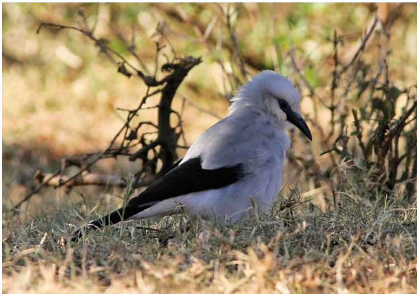
Acaciagaai - Jack Folkers

Weer even verderop zie ik een groepje kleine vogeltjes in een struik zitten. Bruinige vogeltjes met een rode streep over de hals. Ik heb ze eerder gezien tijdens deze trip. Bandvinken is de Nederlandse naam, maar ik vind de Engelse naam leuker: cut-throat finch ofwel "doorgesneden keel-vink". En zo lijkt het ook echt. Het is alsof het keeltje van de vogel met bloed is doorlopen door een lugubere snijpartij. Ze blijven mooi zitten en ik kan er zelfs foto's van maken.