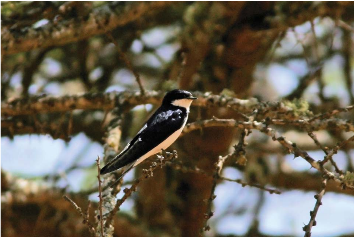
Witstaartzwaluw - Jack Folkers

noemd, maar lijken er helemaal niet op. Het zijn grijze vogels zo groot als een merel met zwarte vleugels en een iets lichtere kop. De geleerden zijn er ook nog niet uit. Eerst waren ze ingedeeld bij de kraaiachtigen, maar onlangs zijn ze bij de spreeuwachtigen ondergebracht. Even verder lopen we in de bush. Doornstruiken, voornamelijk acacia, voeren de boventoon en soms zijn er wat grasvlaktes. We zijn op zoek naar een paar zeldzame leeuwerikensoorten. Een ervan, de Erard-leeuwerik is zelfs met uitsterven bedreigd en komt alleen maar voor op een klein plekje in Zuid-Ethiopië. Hier dus. En dit is de plek waar Meseret hem in het verleden heeft gezien. Om een lang verhaal kort te maken, na 10 minuten lopen zie ik iets bruins onder wat plantenpollen wegschieten. Een bruin beestje, leeuwerikachtig. Na een paar waarschuwingen waarbij we een staart, een rug en een deel van de kop zien en bovendien een geluidje horen, komt Meseret tot de conclusie: "het is hem". Ik vind leeuweriken te moeilijk om het zo gauw te kunnen zeggen en hoewel het verleidelijk is om deze soort op de lijst te zetten, heb ik hem daarvoor niet overtuigend genoeg gezien.