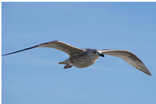
Juvenile Zilvermeeuw of toch Mantelmeeuw?

Schiermonnikoog is uitgeroepen tot de mooiste plek van Nederland en dit kleine eiland kun je het best verkennen op een (schier)fiets van Soepboer. "Kwaliteit voor een redelijke prijs" en daar hebben ze er maar liefst 4000 van. En voor die redelijke prijs konden we ook nog gratis gebruik maken van een fietstas. Wat wil een mens nog meer.