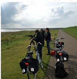
Kijken over wad bij haven