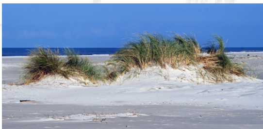
Geen sneeuwgorzen maar wel een mooi stukje duin

Eenmaal op het eiland gingen we, zoals gebruikelijk, met de bus naar het dorp en werden we bij ons onderkomen "Binnendijken" opgewacht en begroet door onze