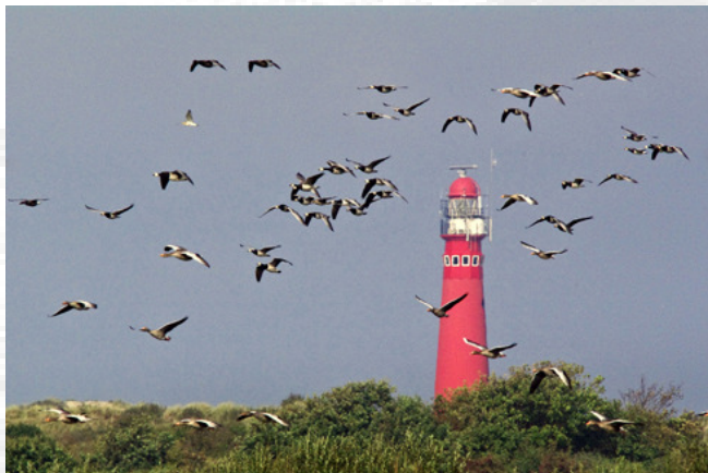
Vlucht Brandganzen boven Westerplas

Dat zijn de eerste drie regels uit het eerste couplet van het volkslied van Schiermonnikoog. In de volle context hebben die betrekking op de eilanders maar als niet-eilander kun je daar ook wel gevoel bij hebben. Ik in ieder geval wel. Vanaf de drukke Randstad moet je met de auto een behoorlijk aantal kilometers overbruggen om in de buurt van het eiland te komen. Maar de bootreis er naar toe zorgt ervoor dat de echte drukte verdreven wordt. De zilte zeelucht, de geur van drooggevallen wad, het geluid van de golven die op de boeg van de boot breken en natuurlijk de roepende meeuwen maken het gevoel compleet.