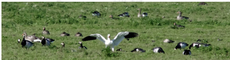
Sneeuwganzen tussen Brand- en Grauwe ganzen

Op de boot hebben we bekeken wat een aardige route zou kunnen zijn. Besloten werd de westkant te pakken aangezien in de Bantpolder Sneeuwganzen waren gemeld en Ezumakeeg een voor de hand liggende locatie is om leuke soorten te zien. De Bantpolder ligt op circa een kilometer afstand vanaf de boot. Direct de eerste afslag rechts brengt je op de parallelweg die je door de polder voert. Een Belgische medevogelaar attendeerde ons op een zeer vreemde 'eend' in de bijt tussen de grote groep Brandganzen. Hij had het grote lompe lichaam van een grauwe gans maar dan niet grauw maar donkergrijs. De nek grauw gekleurd overgaand in wit en rondom het oog een brede ring gelijk de Nijlgans. De snavel was donker met oranje gekleurde vlekken. Wie het weet mag het zeggen (een grauwe fase canadese nijlgans?). Nee, geen blauwe fase Sneeuwganzen; die hebben we later gezien. Drie stuks zelfs en een traditionele witte. Dit laatste exemplaar