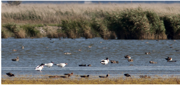
Als toetje twee Reuzensterns

eerste officiële erkende in Nederland. Best wel apart dus. Maar helaas, maar wat is helaas, het waren 'gewone' blauwe fase Sneeuwganzen. Sneeuwganzen zijn namelijk groter dan Ross Ganzen. Ook de nek is langer en de snavel van de Ross Gans is kleiner en heeft niet de donkergerande ondersnavel. Van de Sneeuwganzen zijn twee ondersoorten bekend: de Grote en de Kleine. Tot 1961 werd de blauwe fase ook beschouwd als een aparte ondersoort maar na genetische controle is gebleken dat het dezelfde soort is als de witte (die homozygoot recessief is) maar het resultaat is van een enkel dominant gen. Leuke waarnemingen dus waarbij ook nog het groepje Casarca's genoemd moet worden.