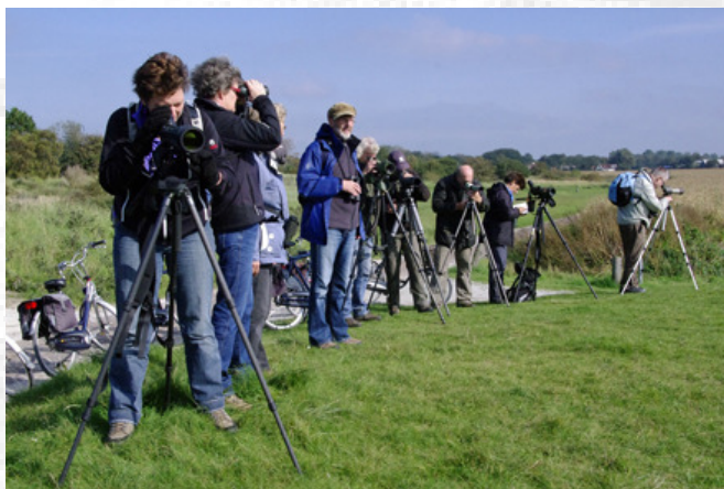
Een deel van de groep Schiermonnikoog 2010.

De rest van de middag zou het bleke zonnetje onze verdere waarnemingen mooi belichten en voor anderen was het zonnetje een reden om een terrasje op te gaan zoeken en een drankje te nuttigen. Genieten dus.