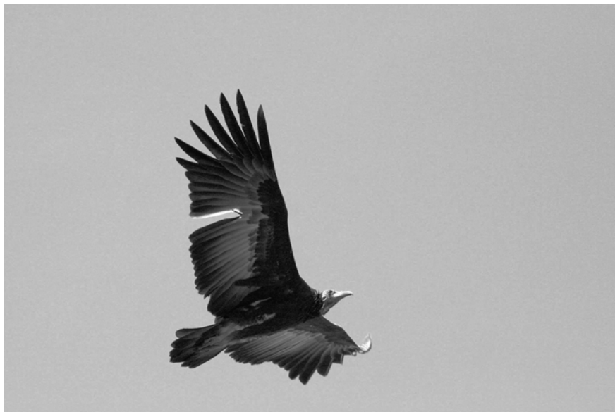
Hooded vulture (kaggier) – Barend van Gernerden

Barend van Gernerden & Bernd de Bruijn Vogelbescherming Nederland