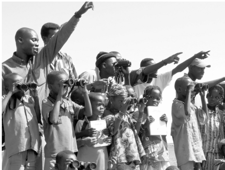
Scholieren uit Oursi op excursie met kijkers van Vogelbescherming - Barend van Gernerden

De afhankelijkheid van deze mensen van het water (niet de vogels!) in dit gebied is de ingang die NATURAMA gebruikt om veranderingen in gebruik te bewerkstelligen. In het dorp is inmiddels een lokale groep natuurbeschermers actief. Deze "Site Support Group Oursi" komt uit het dorp zelf en kent de waarde en de problemen van het gebied als geen ander. De leden van de groep zijn door NATURAMA opgeleid in zaken als natuurbescherming, vogelinventarisatie en voorlichting. Samen met deze groep en de lokale bevolking worden nu gesprekken gevoerd over welke aanpassingen het "traditionele" landgebruik nodig heeft zodat het in overeenstemming is met de draagkracht van het gebied.