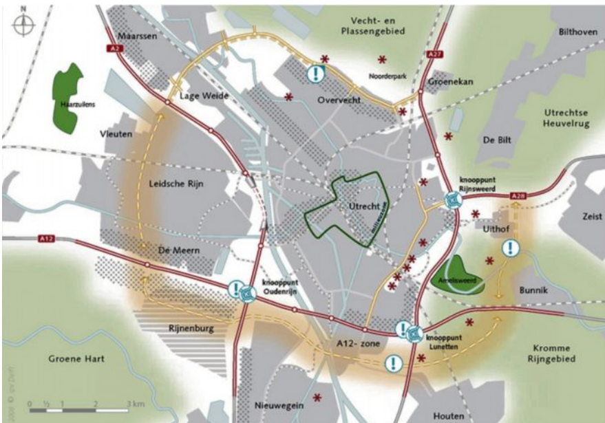
Figuur 1 Alternatief "spreiding" - Extra ring rond Utrecht.

Ook de omgeving van Utrecht en Amelisweerd is onderwerp van plannenmakers, zo bleek afgelopen december, toen de startnotitie "Ring Utrecht" van het ministerie van Verkeer en Waterstaat verscheen. In het kort komt de startnotitie erop neer dat vier varianten worden gepresenteerd voor de verbreding dan wel omleiding van snelwegen rondom Utrecht, waarbij één variant een nieuwe weg projecteert dwars door het groengebied ten zuiden en ten oosten van de stad Utrecht. Deze weg, waarvan het tracé globaal wordt aangegeven, moet de snelwegen rondom de stad Utrecht ontlasten en regionaal verkeer leiden van Utrecht-West via het groengebied bij de forten Nieuw Wulven en 't Hemeltje tussen Houten en Utrecht, door de Uithof via Rhijnauwen en landgoed Oostbroek naar de A28 (zie figuur 1).