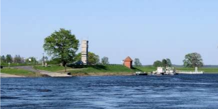
Wachttoren langs de Elbe - Sjef ten Berge

rivierloop zuidwestelijk van Pevestorf met veel watervogels. Tussen twee rivierarmen is een eiland ontstaan door een doorbraak; slikkige oevers en zanderige modderpaden. Oeverloper, kleine plevier, veel eendensoorten waaronder zomertalingen, dodaarzen, geoorde futen en futen. Het is er allemaal en erboven, hoog, een juveniele zeearend. Dankzij de modder zijn de sporen van een das niet te missen en in de ondiepe plassen dansen de watervlooien met zoveel enthousiasme, dat er rond de plas een rode rand zichtbaar is van verongelukte exemplaren.