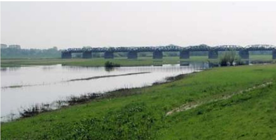
Spoorbrug bij Kaltenhof - Sjef ten Berge

De middag is voor de overkant bij Dömitz. Bij een rivierduincomplex van een kleine veertig meter hoog grenzen duin, droog bos en moerassige uiterwaard in een soort drielanderschapspunt aan elkaar.