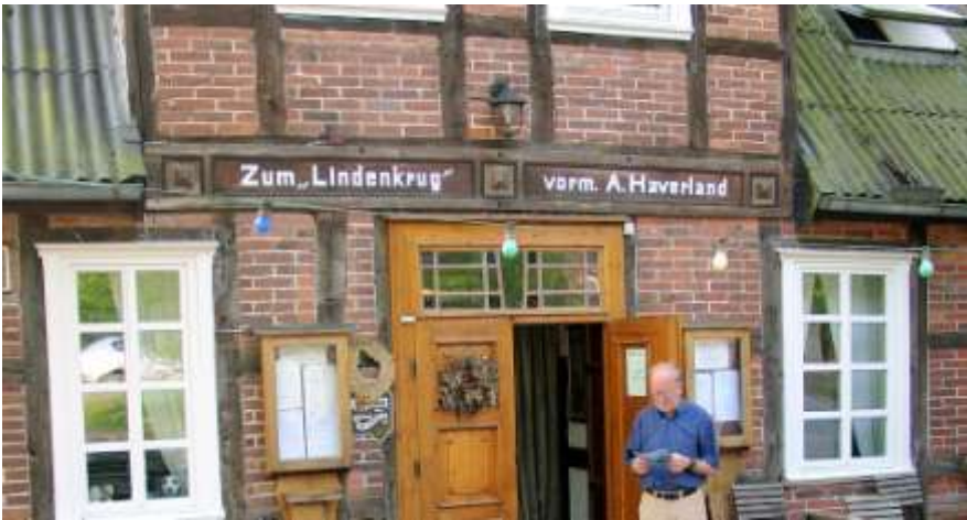
De auteur voor hotel Lindenhof in Peverstorf

Voor de middag is ons doel een essenbos (een hardhoutooibos), het Elbholz, dat veel minder vaak dan de wilgen- en populierenbossen op overstromde grond staat. Nu echter, één maand na het hoogwater van de laatste Elbe-overstroming, staat ook het hardhoutooibos met zijn wortels ruim twintig centimeter onder water. Toch vinden op de dijkellingen en de hogere uiterwaarddelen de gele kwikstaarten al grasland genoeg om te broeden en zich te voeden. De rietgorzen en braamsluipers zoeken het wat hogerop. Vanwege de muggen is het verhoogde dampad door het Elbholz minder geschikt om rustig holenduif, zwarte specht en appelvink te bekijken. Terug naar het hotel komen we langs een stukje terrein dat de ideale broedhabitat voor de grauwe klauwier moet zijn. Na een kwartier hebben we beet en als even later ons dralen ook nog beloond wordt met een rode wouw die een jonge zeearend test op z'n wendbaarheid, vinden we dat een prima besluit van de middag en gaan we op het terras nog wat nagenieten.