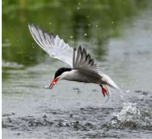
Visdief - Jan van der Greef

Na de presentatie van de nieuwe website gaf Sjoerd Dirksen een lezing over het eiland De Kreupel en de visdief. Sjoerd is bioloog en lid van de Vogelwacht. Grotendeels in eigen tijd doet hij onderzoek naar de vogels van De Kreupel; een nieuw eiland in het IJsselmeer, niet ver van Enkhuizen. De Kreupel is genoemd naar een ondiepte, waarop het gelijknamige eiland is gemaakt van grond die vrijkwam bij het uitbaggeren van vaargeulen zo'n tien jaar geleden. Sjoerd nam destijds bij de aanleg al een kijkje. Spoedig vestigden zich broedende visdieven. De kolonie groeide uit tot de grootste van West-Europa. Toch gaat het niet helemaal van een leien dakje, want in sommige jaren sterven de jongen massaal door voedselgebrek. Er is dan te weinig spiering.