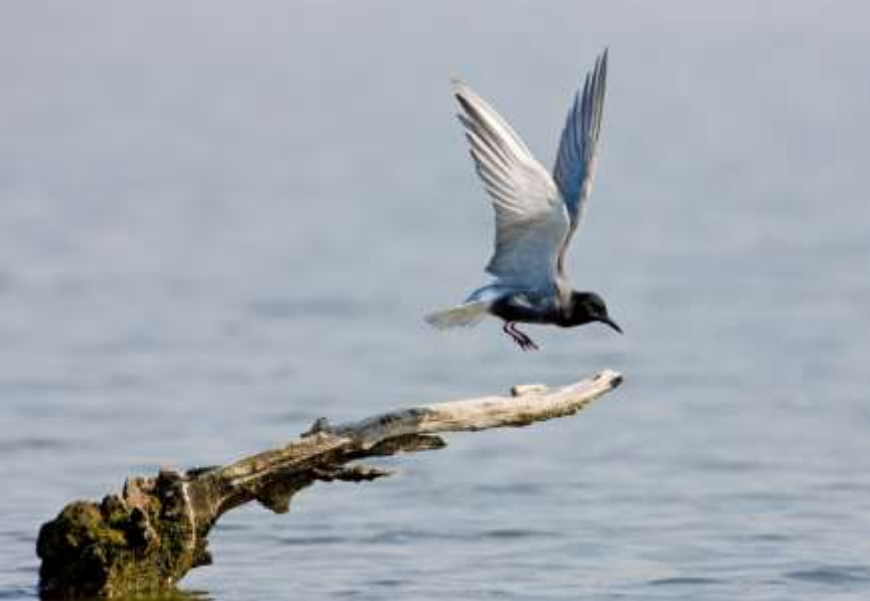
Zwarte stern