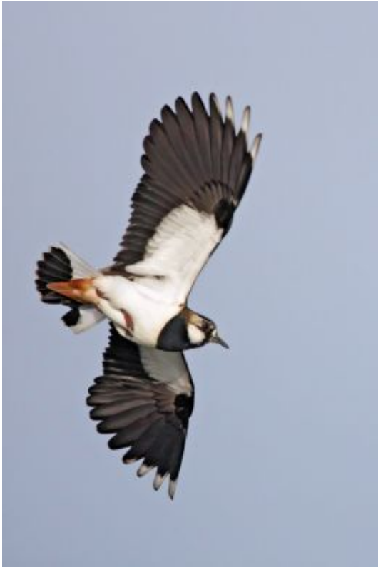
Kievit - Jan van der Greef

zien en worden als een Nederlandse bijdrage in het kader van de harmonisatie van maatregelen tot bescherming van de kievit in de Benelux. Woedende Friese vogelbeschermers hebben inmiddels laten weten na 5 april gewoon te zullen doorgaan met het rapen van de eieren. Pas op 13 april wordt hiërmede gestopt.