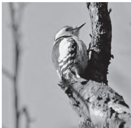
Middelste bonte specht

Op 18 mei hebben we de mensen van de golfbaan Amelisweerd geassisteerd met hun jaarlijkse vogeltelling. Het was een vroege maar leuke ochtend en ook al leverde die geen spetterende soorten op, als we