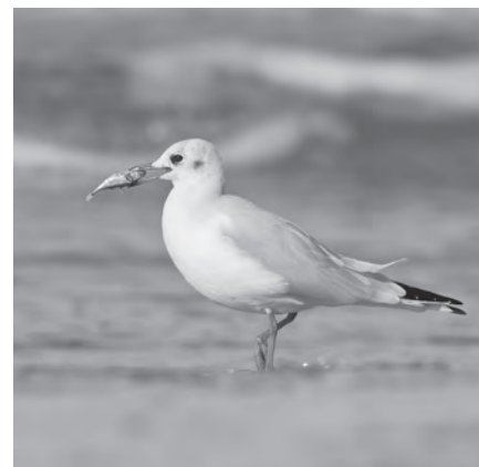
Kokmeeuw | Michael Kars

16 april, Schouwen Inlagen en Prunjepolder, 10 deelnemers, ruim 70 soorten | We werden aan de zuidrand van Schouwen beloond met groenpootruiter, IJslandse grutto, heel veel kluten en op kleine eilandjes kokmeeuwen, die hun broedpose al aangenomen. De zil-verplevier aan de andere kant in de Flauwers inlagen en de compacte groep lepelaars wa-