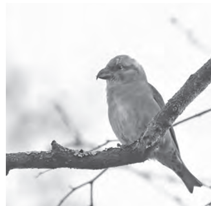
Kruisbek | René de Waal

Na de pauze werd de bijeenkomst vervolgd met de presentatie van Jan van der Winden over het vogelproject 'Grote karekiet' . Bij dit project wordt onderzoek gedaan naar de oorzaak van de enorme afname sinds 1950 van ongeveer duizend paar tot minder dan 100 paren tegenwoordig. In Nederland zijn nu nog maar twee bolwerken waar jaarlijks meer dan tien paren grote karekieten broeden, namelijk in de Oostelijke Vechtplassen en de Noordelijke Randmeren. Grote karekieten nestelen in brede, hoge rietkragen die langs oevers van diep water staan. VBN en SOVON hebben met onderzoek actie ondernomen om het tij te keren. Jan van der Winden is nauw bij dit onderzoek betrokken geweest. Hij heeft gedetailleerd over zijn onderzoek verteld, welke knelpunten er zijn en welke maatregelen zijn genomen. Het onderzoek was in de eerste plaats gericht op het verdwijnen van het waterriet, om daarna maatregelen te treffen om de basisstructuren van moerassen te verbeteren. Een voorbeeld hiervan is in Loosdrecht (Oostelijke Vechtplassen); sinds het afrastereen tegen vraat van ganzen is de populatie niet verder gedaald. Toch waren de resultaten onvoldoende om de teruggang van de grote karekiet te verklaren, dus werd er verder onderzoek gedaan. In 2016 werden de