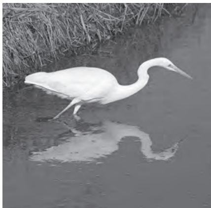
Grote zilverreiger | Henk Tromp

Eempolder, 22 juni: 7 deelnemers, 60 soorten | Vanaf de Volkersweg gaan we richting oude zeedijk, genietend van veldleeuwerik, kleine karekiet, rietzanger, lepelaar, ooievaar, grote zilverreiger, een jagende juveniele bruine kiekendief, opschroevende buizerd en biddende torenvalk. Op een grasland een grote groep kokmeeuwen en kleine mantelmeeuwen met een aantal zwartkopmeeuwen. Verderop gele kwikstaarten. We horen een grote karekiet vanuit het riet zingen. Als verrassing duikt het kopje van een hermelijn op. Het is nog