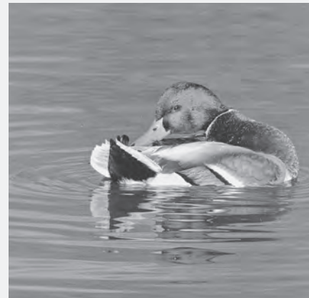
René de Waal