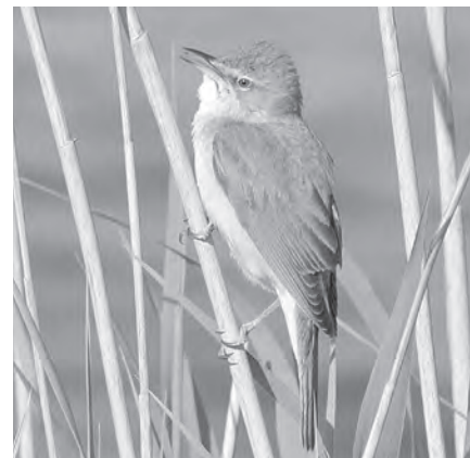
Grote karekiet | Bert Geelmuijden

Het verslag van de kascommissie | De kascommissie heeft steekproeven gedaan en van bedragen bij de afschriften van de bank gecontroleerd of saldi terug te vinden waren, en dit zag er overtuigend uit. De conclusie was dat alles in prima handen is bij de penningmeester en dat de financiën van de vereniging goed op orde zijn. De aanwezigen werd gevraagd het voorstel van de kascommissie over te nemen om de penningmeester en daarmee het bestuur decharge te verlenen over het verenigingsjaar 2018. De voorzitter interpreteerde het applaus als