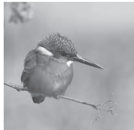
Ijsvogel | Toon Vernooij

Midwintertelling roofvogels | De resultaten van de midwintertelling waren bovengemiddeld goed. Misschien speelde een rol dat de dag ervoor erg regenachtig was geweest. De buizerds lieten zich meer dan anders zien en het lijkt er op dat de torenvalk in deze twee blokken goed aan de kost komt. Misschien veel muizen. Hoe dan ook een aantal van 64 buizerd, één havik, één sperwer en zes torenvalken maakt een totaal van 72. Dit aantal hebben we nog nooit geteld. Tot nu toe was 2014 met 67 vogels ons maximum.