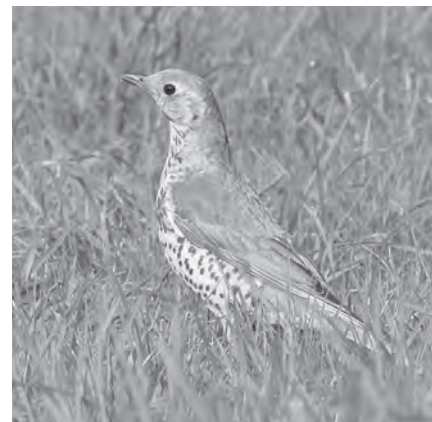
Grote lijster | René de Waal

Zondag 26 mei: Groene Jonker, Ruygeborg, Kockengen o.l.v. van Gerhard. Aantal deelnemers: 8; weer: bewolkt; 55 soorten waaronder in de Groene Jonker: grutto, tureluur, blauwborst, zwartkopmeeuw, bergeend met jongen, zomertaling, tafeleend, sprinkhaanzanger, bosrietzanger, krakeend, slobbeend, smient, manke krombekstrandloper, kleine