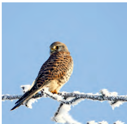
Torenvalk